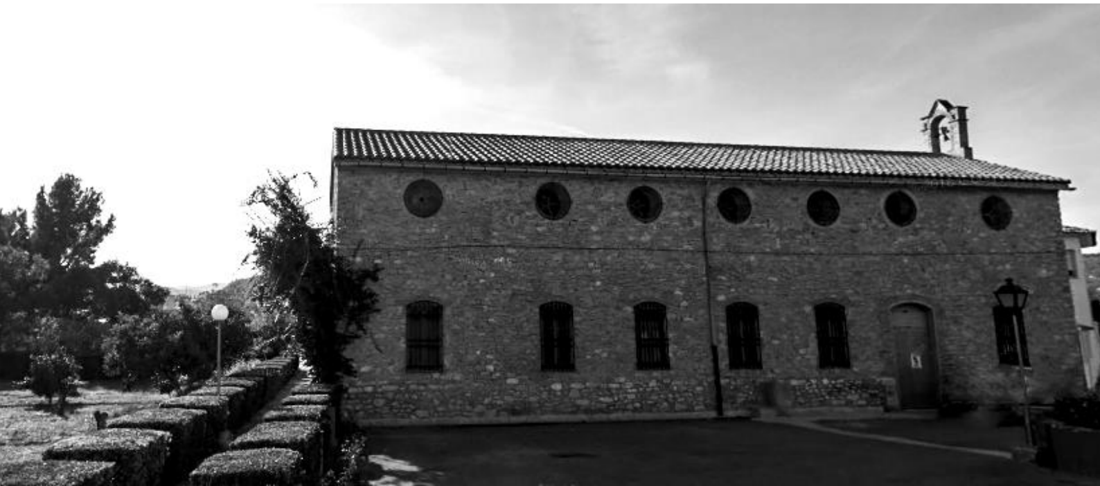
Iglesia de la comunidad de las Hermanas Terciarias Capuchinas de la Sagrada Familia