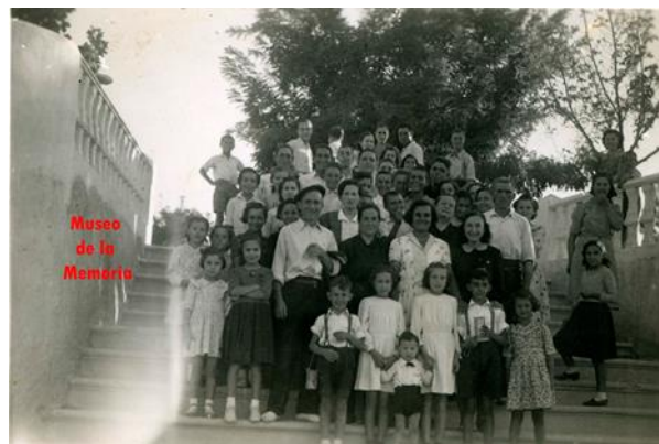
En la escalinata de acceso a La Glorieta, ca.1943.