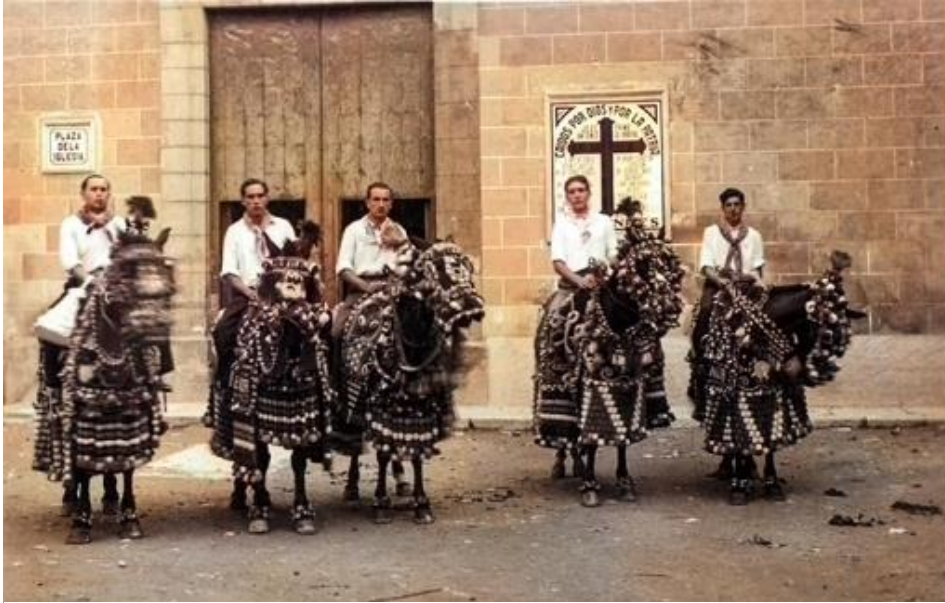
Fiesta de los Mozos, 8 de mayo, en honor de san Miguel, arcángel.