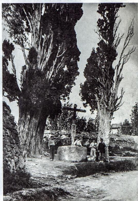
Antes de 1936

⑦ Que se proceda a la limpieza de todas las calles y muros con motivo de las próximas fiestas.