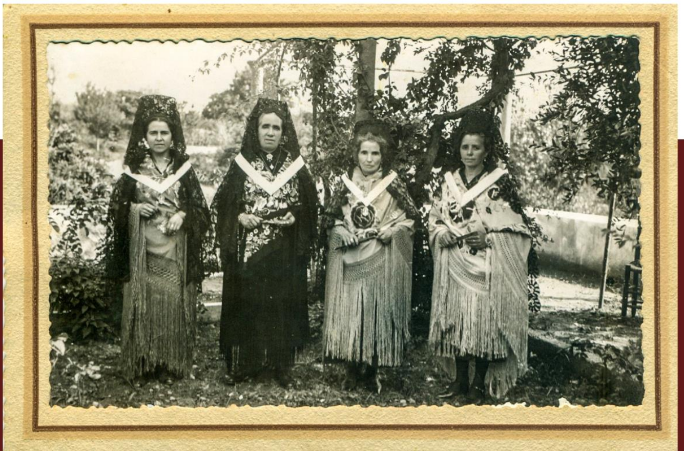
Camareras de la virgen de Gracia, 1941.